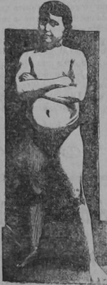
EDAD 11 AÑOS

La transformación maravillosa de un sér endeble y raquítico en un adolescente fuerte, robusto y sano, como lo demuestra su atlética figura, fué obra realizada por la